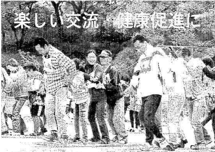
楽しい交流・健康促進に 賞品どっさり・福引き大会も